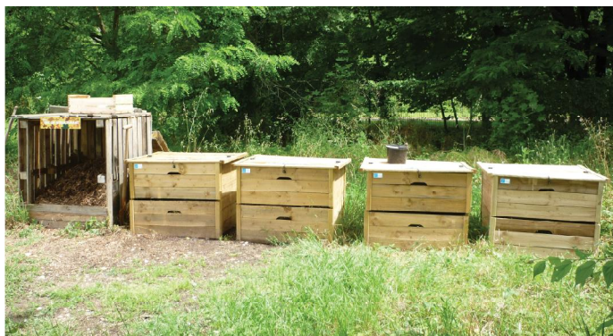
Placette de compostage du collège André Cotte à St-Vallier

Le nombre de collèges sera étendu à la rentrée.