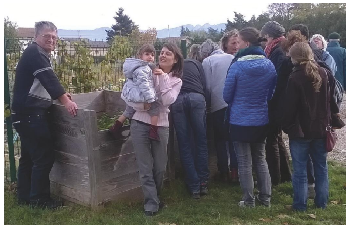
Visite du composteur de la Maison des Ors à Romans pendant une formation de guides-composteurs en 2015

La spécialisation portera sur la gestion intégrée des déchets verts ou la gestion d'un site de compostage partagé.