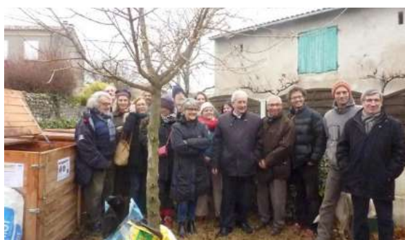
Inaugurations de sites de compostage collectif à Grâne, Alex, Francillon-sur-Roubion et Beaufort-sur-Gervanne (de gauche à droite et de haut en bas)