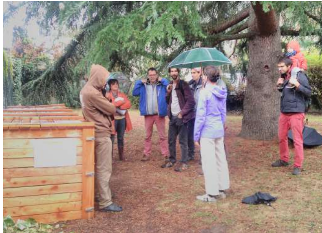
Fête des possibles à Crest