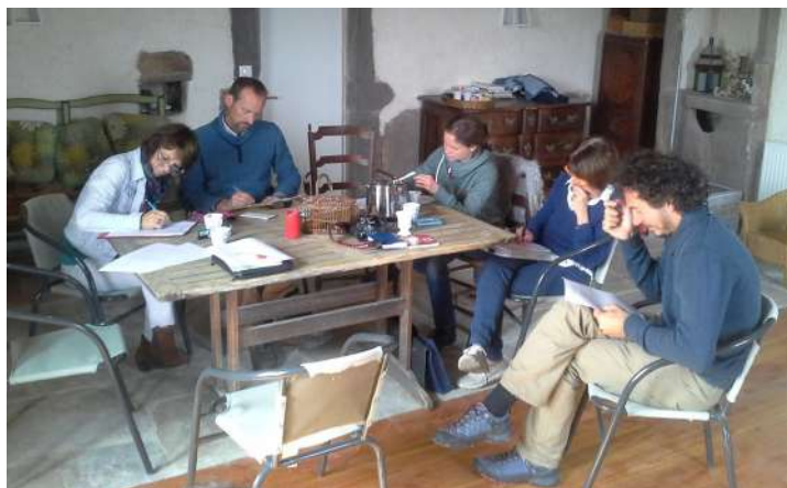
Ambiance studieuse mais décontractée pendant le séminaire dans un gîte à Chabrilan