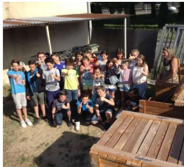
Classe ambassadrice du compostage, Collège Debussy de Romans