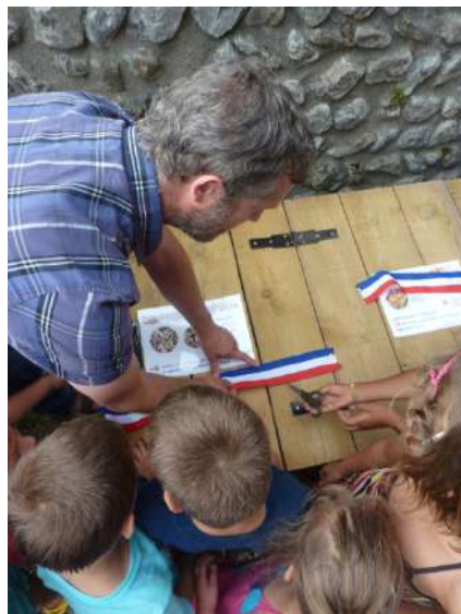
Inauguration du site de compostage de l'école de Bésayes

>L'objectif initial d'accompagner le compostage dans les écoles est atteint. L'ambition secondaire visant à impulser une dynamique territoriale a peu progressé sur le périmètre concerné, tant au niveau de l'Agglo Valence-Romans que de la Communauté de communes Rhône-Crussol.