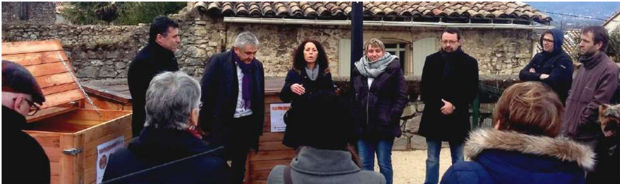
Inauguration du site de compostage collectif de Livron-le-haut