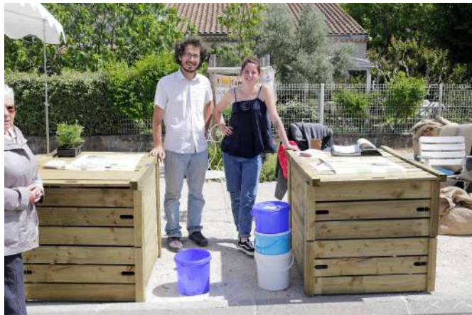
Stand d'info pendant Croquons Nature à St-Marcel