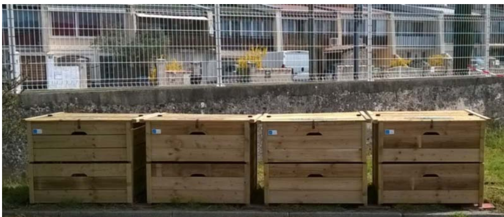
Place de compostage installée au Collège Jean Macé de Portes-les-Valence

En décembre 2015, nous répondions à un appel à marché lancé par le Département de la Drôme, pour installer des composteurs dans 3 collèges de la Drôme : au collège Jean Macé à Portes-les-Valence, au