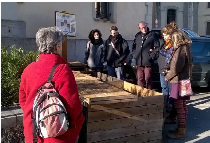
Visite de sites de compostage collectif à Chambéry avec Compost Action en décembre 2016

Compost et Territoire envisage de rentrer au Conseil d'Administration du Réseau Compost Citoyen Rhône-Alpes (AG du réseau les 9 et 10 mars 2017 à Ambert dans le Puy-de-Dôme) et d'organiser notre journée Prévention en partenariat avec le Réseau.