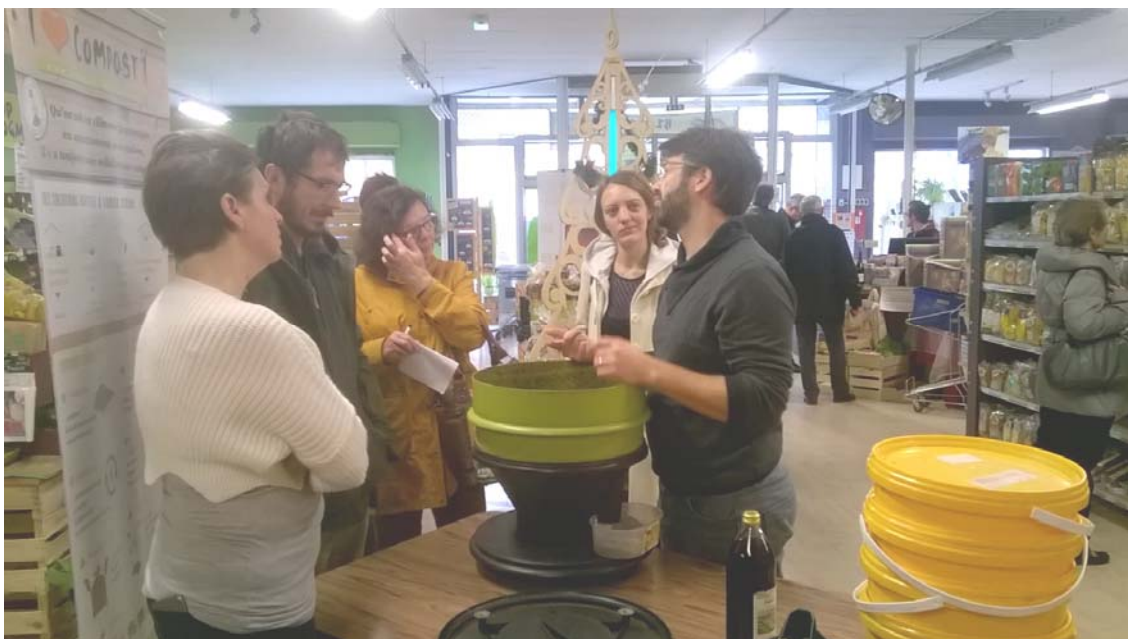
Atelier info lombricompostage à Valence à l'occasion de la Semaine Européenne de Réduction des Déchets