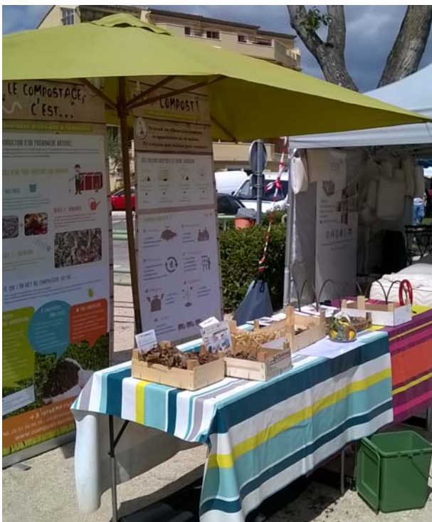
Stand d'info à l'Éco-Foire de Nyons en mai 2016

Une de nos priorités était d'améliorer notre communication et de nous doter de supports attractifs pour nous faire connaître et participer à des salons/foires avec un stand digne de ce nom. Nous avons donc fait appel à une infographiste pour concevoir un nouveau flyer grand public présentant l'association et son activité, tiré à 2000 exemplaires. Nous avons également fait produire 3 rolls-ups.