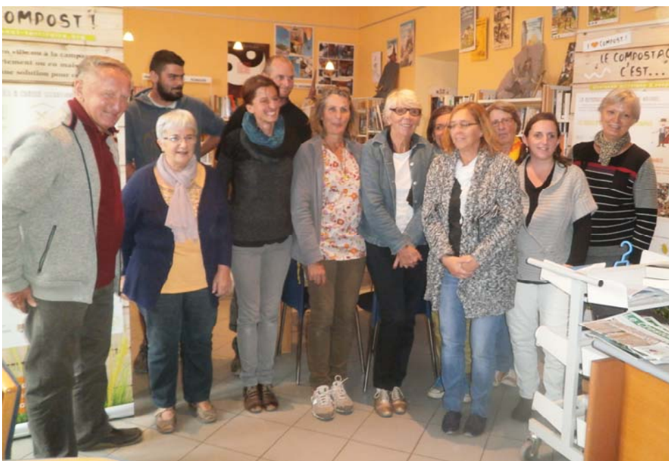
Lancement de l'itinérance « Sur le Chemin de Compost'elles » le 22/09/2016 à l'écosite de Eurre ; Clôture à la bibliothèque de Eurre le 06/10/2016