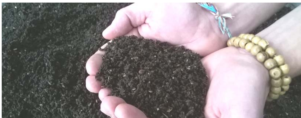
Habitants composteurs de St-Ruf à Valence ; compost mûr tamisé du site de St-Ruf